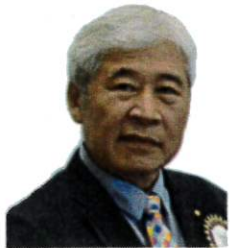
秘書 沈 勝 漳 TradeMax