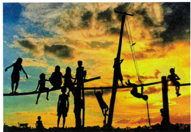
マニラ(フィリピン)の貧困地域で遊ぶ子どもたちのシルエット

最優秀作品