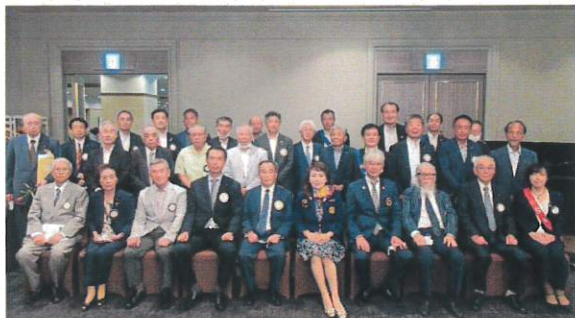
国際ロータリー第2640地区