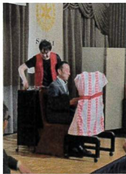
ビンゴゲーム 平塚親睦活動委員