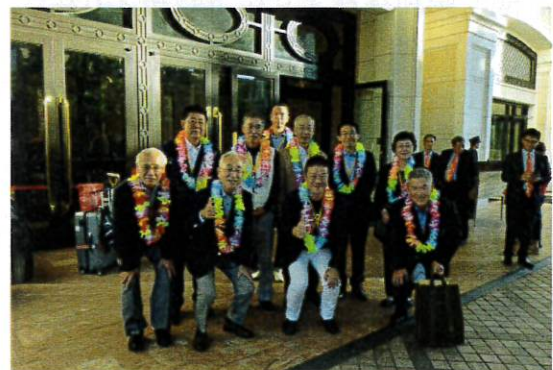
国際奉仕委員会より