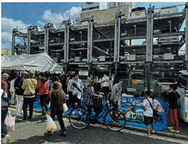
(紀陽銀行堺支店駐車場前にて)

10月15日(日)堺まつりにおいて、紀陽銀行堺支店様の駐車場をお借りして、例年同様、チャリティーバザーを開催いたしました。当日は晴天に恵まれ、バザー開始前から店頭には多くのお客様が並ばれていました。10時から16時まで、堺RAC会員計12名と地区RAC1名で運営を行い、売上113,750円と献金63,600円の合計177,350円が今後の活動に充てる資金となりました。また、多くの堺RC会員の皆様にお越しいただき、店頭での声掛けや呼び込みへの協力や、飲料等の差し入れをいただき、全員で最後まで明るくやり上げました。バザーでの売上と献金をもとに、年明けから児童福祉施設訪問等の奉仕活動を行わせていただきます。今後とも、ご指導ご鞭撻のほどよろしくお願い申し上げます。