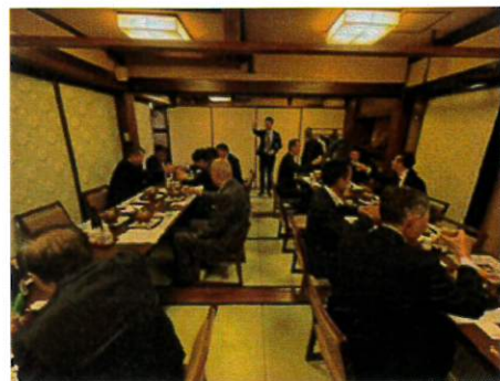
ロータリー情報委員会より