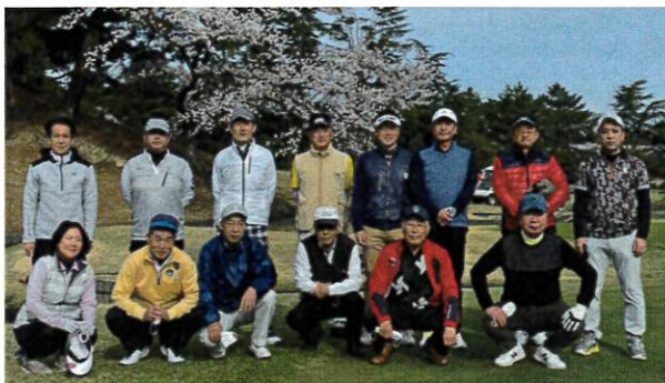
場所：聖丘カントリー倶楽部

第249回SR会が、4月2日(土)に開催されました。14名のご参加の皆様方と晴天の中、満開の桜を楽しみながらのゴルフは最高でした。次回も趣向を凝らしてのゴルフを計画致しますので、ゴルフ愛好者の方々は、奮ってご参加下さいますようお願い申し上げます。