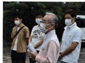
浜寺公園内にて清掃活動